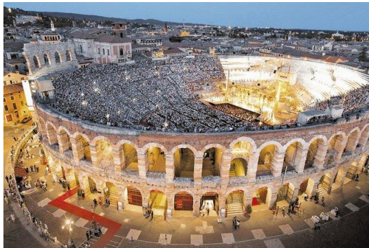
Opernschauplatz Arena di Verona

Individuelle Anreise nach Malcesine. Check-In im Hotel Castello Lake Front. Genießen Sie einen entspannten Nachmittag mit Caffé oder Aperitivo auf der Hotelterrasse nur wenige Meter vom See entfernt. Der Blick auf die nahe gelegene, wuchtige Scaligerburg hat schon Goethe auf seiner „italienischen Reise“ zu einer Skizze inspiriert. Bummeln Sie am Abend durch den Ort und lassen den Tag in einem der vielen Lokale im Ort oder am Hafen ausklingen. Gerne geben wir Ihnen gerne Tipps oder reservieren einen Tisch für Sie.