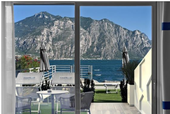
Blick aus dem Hotel