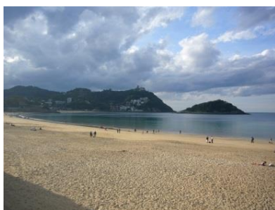
Bucht „La Concha“ San Sebastian