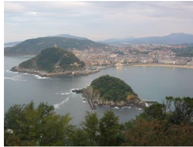
Bucht von San Sebastian