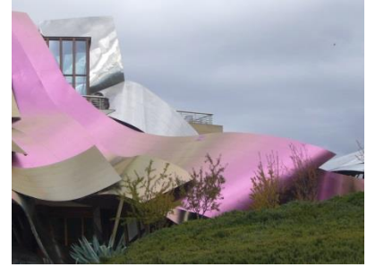
Bodega Riscal, Rioja

Zwei „ungleiche Schwestern“ stehen im Mittelpunkt unserer Reise an die nordspanische Atlantikküste. Bilbao, die alte Kohleindustriestadt hat den Strukturwandel der vergangenen 20 Jahre hervorragend gemeistert und begeistert seine Besucher besonders mit dem aufsehenerregenden Bau des Guggenheim Museums. San Sebastian besticht durch seine Lage an der weiten Bucht La Concha. Die Nähe zum Meer begünstigte seit alters her die Entwicklung zu einer der bedeutendsten Handels- und Hafenstädte, insbesondere im Fisch- und Seehandel mit Amerika. Ein bedeutender Künstler der Gegenwart ist der baskische Bildhauer Eduardo Chillida, dessen raumgreifende Skulpturen hier in seiner Heimatstadt zu bewundern sind. Auch für kulinarisch Interessierte hat die Stadt Einiges zu bieten, gilt doch San Sebastian als Mekka des guten Essens.