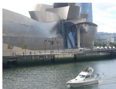
Guggenheim Museum Bilbao