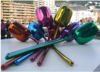
„Tulpen“ am Guggenheim Museum